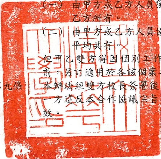
國立清華大學校長